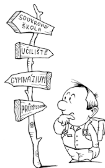
Obr. 2 Nerozhodnost při volbě povolání

Vyhláška 6 , která tuto oblast upravuje, definuje poradenské pracovníky čtyř kategorií a jimi vykonávané standardní činnosti. Jejich odborná kvalifikace je stanovena zákonem o pedagogických pracovnících 7 a splnění dalších kvalifikačních předpokladů vyhláškou o dalším vzdělávání pedagogických pracovníků. 8