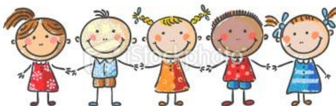
Obr. 1 Šťastné děti

Pro učitele a kariérové poradce na základní škole to znamená citlivě pomáhat žákům a jejich zákonným zástupcům při jejich hledání, rozhodování a volbě střední školy. Všichni zúčastnění musí mít na mysli, že se nejedná o chvilkové rozumové řešení, ale je to výsledek dlouhodobého procesu sebeurčení člověka ve světě práce. U každého jedince je velmi důležité formovat správné životní cíle, postoje a možnosti a určit strategie životního plánování. Důležitými činiteli, které sehrávají rozhodující roli při hledání pomoci a rady jsou žákům jejich rodiny a škola. Abych získala a rozvíjela své dovednosti v oblasti kariérového poradenství, navštěvovala jsem Vzdělávání školních kariérových poradců, které bylo součástí projektu „Implementace Krajského akčního plánu rozvoje vzdělávání pro území Zlínského kraje“.