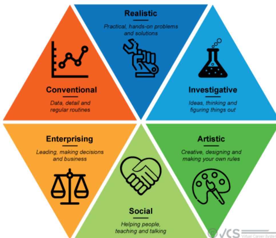
Obr. 4 Hollandův test typů osobnosti- RIASEC

Dle osobností a pracovního prostředí lze zařadit většinu lidí do jedné ze šesti kategorií typů osobnosti. Podobně rozlišil i šest typů pracovního prostředí. 20 V rámci kariérní volby hledají jedinci pracovní prostředí, které bude shodné s jejich typem osobnosti. Pokud dojde ke shodě mezi osobnostním typem a typem profesního prostředí, hovoříme o „dobré volbě“, která pravděpodobně povede k úspěchu ve studiu, v dané profesi, a povede i k pocitu spokojenosti v práci.